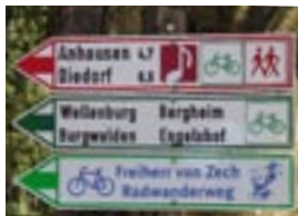
Auch die Beschilderung des Radwanderwegs hat die Brauerei übernommen.

setzen: einen Rast- und Picknick-Platz in Reinhartshausen, Nordic-Walking-Stützpunkte, Radwanderkarten, gemeinsame Öffentlichkeitsarbeit und einiges mehr. Für die Freiherr von